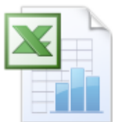
第22屆運動會成績登錄表 _20131014.xls